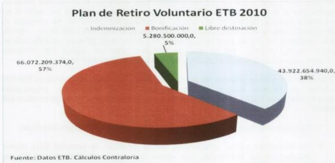
Gráfico No. 1